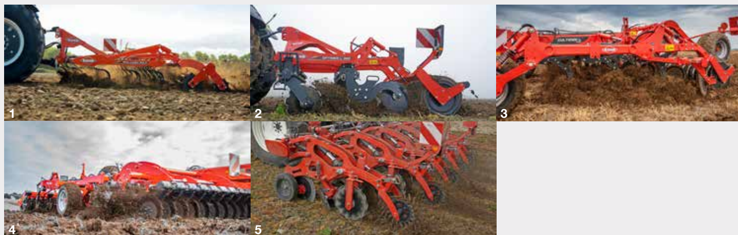
1. PROLANDER - 2. OPTIMER L-XL - 3. CULTIMER M-L - 4. PERFORMER- 5. DISCOVER-DISCOLANDER - 6. STRIGER 100

KUHN-HUARD SAS - Zone Horizon - 2, Rue de Québec - F-44110 CHATEAUBRIANT - France